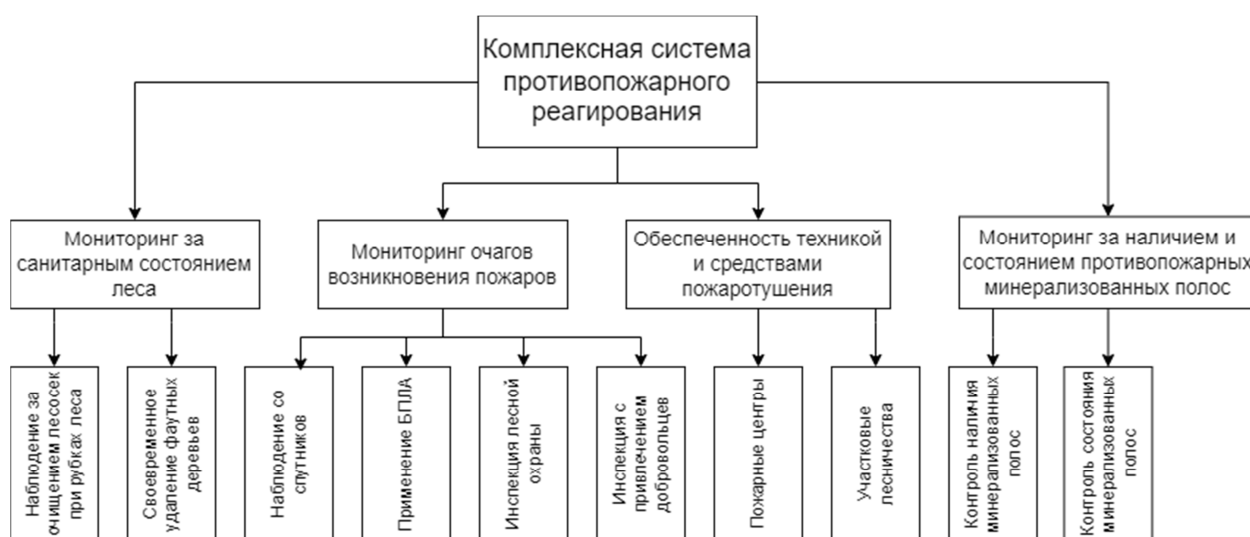
Рисунок 4-Комплексная система противопожарного реагирования

Анализ представленных методов, обзора литературных источников, технической документации и др. позволил нам представить схему организации борьбы с распространением пожаров в лесных экосистемах. Комплексная система (схема) противопожарного реагирования представлена на рисунке 4.