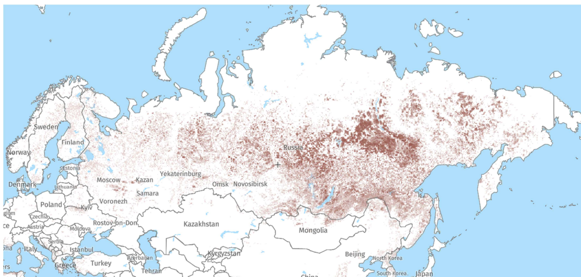
Рисунок 3 – Карта зон лесных пожаров в России с 2001 года по 2022 год [2]

Из рисунка 3 следует, что зоны лесных пожаров имеют большой разброс по всей территории страны, но наибольшее их количество наблюдается в юго-восточной части Сибири и растёт с каждым годом. Пожары, которые там происходят, имеют негативный долгосрочный эффект как на жизнь и здоровье самого человека и его инфраструктуру, так и на биоразнообразии флоры и фауны региона.