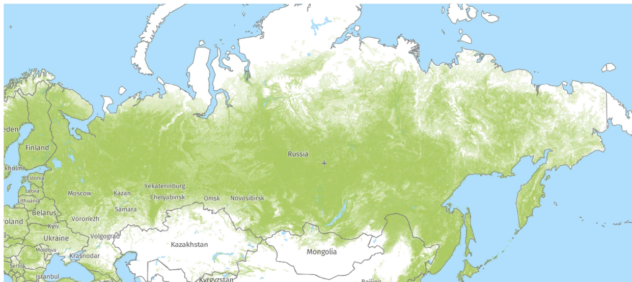
Рисунок 1 – Распределение площадей лесных массивов в Российской Федерации на 2022 год [2]

Из рисунка мы можем отчётливо видеть, что, не считая северных территорий страны и некоторых небольших участков на юге, вся остальная зона покрыта лесами с высотой деревьев от 5 метров и выше, а также плотностью насаждений выше 0,3.