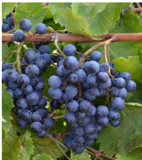
Рис. 2 Гибридная форма винограда технического направления Ш - 62-9

Лист средний, средней рассеченности почти цельный, с вытянутой вершиной. Верхняя поверхность листа светло зелёная, гладкая. Нижняя часть листовой пластинки - слабо-щетиная. Зубчики по краям листовой пластинки выпуклые, наклонённые, с чередованием длинные и короткие. Черешковая выемка открытая и широко открытая, черешок короче главной жилки листа. Одревесневший побег светло-зелёного цвета.