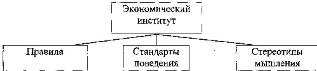
Рисунок 1 – Структура понятия экономического института по В. Нил (W. Neale)

Один из наиболее признанных исследователей, занимавшихся проблемами институциональной теории, Д. Норт определяет понятие "институт", как создание человеком ограничений, которые структурируют политическое, экономическое и социальное взаимодействие. Согласно другому его определению, это «правило, механизмы, обеспечивающие их выполнение и нормы поведения, которые структурируют повторяющиеся взаимодействия между людьми». В приведенной ниже работе Д. Норт описывает институты, как «формальные правила, неформальные ограничения и способы обеспечения действительности ограничений». 2