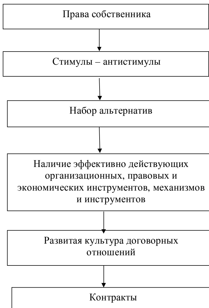
Рисунок 4 – Институциональные составляющие, определяющие эффективность реализации права собственника (составлено автором)

С учетом внесенных нами дополнений и изменений модель реализации прав собственников в контрактах будет такой, как представлена на рисунке 4.