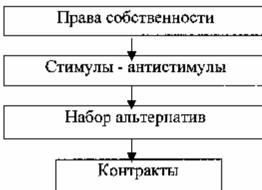
Рисунок 3 – Реализация прав собственности в контрактах

Между тем, из данной схемы выпали организационные и правовые институты (организации, а также механизмы и инструменты, позволяющие осуществить реализацию прав собственности в контрактах по данной схеме). Как показал опыт функционирования экономики нашей страны, в период первичных рыночных трансформационных преобразований отсутствие соответствующих изменений в праве, а также организационных, экономических и правовых институтов, инструментов и механизмов привело к тому, что, по определению В.М. Полтеровича, страна, как и большинство стран Восточной Европы, попала в «институциональную ловушку», основными характеристиками которой были: