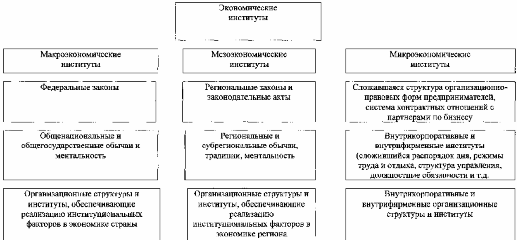
Рисунок 6 – Классификация экономических институтов по уровню их функционирования в экономике (составлено автором)