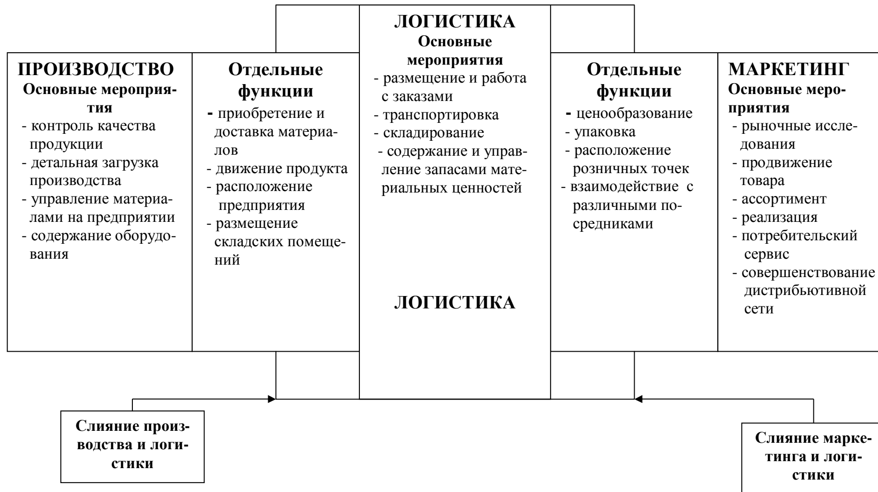
Рис. 3. Место логистики в деятельности предприятия АПК