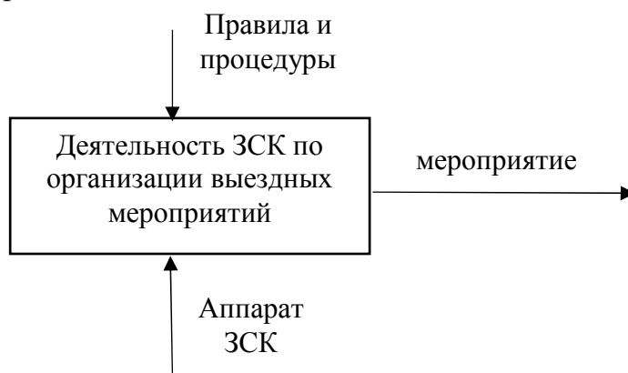
Рисунок1 - Контекстная диаграмма

Описание системы в общем виде представлено в контекстной диаграмме, которая показывает взаимодействия системы с внешней средой.