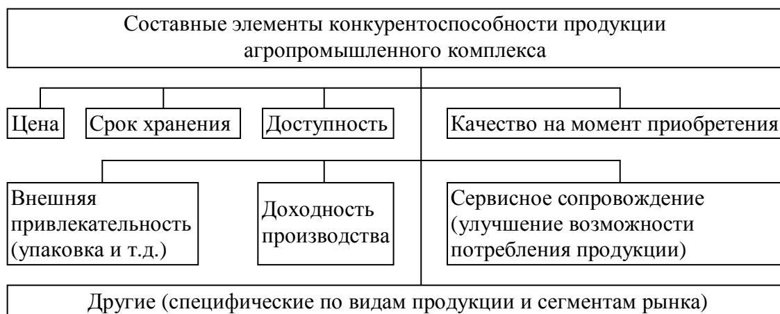
Рисунок 2 – Составные элементы конкурентоспособности продукции агропромышленного комплекса

производства, хозяйствующих субъектов, отрасли, региона и страны.