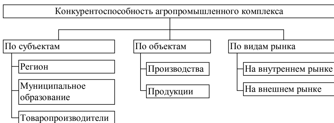
Рисунок 1 – Виды конкурентоспособности агропромышленного комплекса

Необходимо различать конкурентоспособность страны, отрасли, региона, района (муниципального образования), хозяйствующего субъекта, производства и товара (рисунок 1).