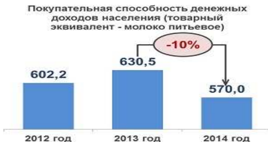
Рисунок 2 – Покупательная способность денежных доходов населения России (по данным Росстата)

Следует подчеркнуть, что кризисные явления в экономике России, вызвавшие разгон инфляционных процессов, привели к росту цен на молоко и молочную продукцию на потребительском рынке. Так, за 10 месяцев 2015 г. цены увеличились 13,9 %. При этом покупательная способность денежных доходов населения (товарный эквивалент – молоко питьевое) снизилась в 2014 г. на 10,0 % по сравнению с 2013 г. (рис. 2).