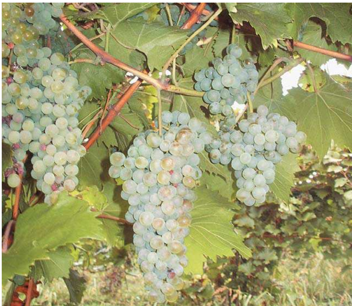
Рис. 2. Комплексно-устойчивый технический сорт Первенец Магарача

Ампелографическая коллекция, благодаря генетическому разнообразию, является источником селекционного материала. В институте «Магарач» на базе ампелографической коллекции выведены сорта винограда с комплексом хозяйственно-ценных признаков, среди которых устойчивость к болезням и вредителям, ранний срок созревания, высокая урожайность. Широко известны такие сорта селекции института, завоевавшие признание не только в нашей стране, но и за рубежом: Первенец Магарача (рис. 2), Юбилейный Магарача, Антей магарачский, Нимранг устойчивый, Подарок Магарача (рис. 3) и др.