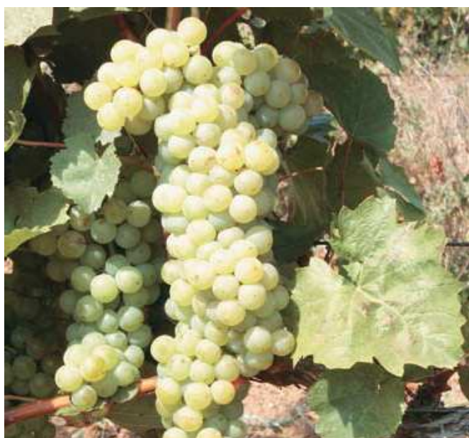
Рис. 5. Винный сорт Цитронный Магарача

Как выше сказано, Магарачская ампелографическая коллекция являлась и остается материнской многих национальных коллекций-генофондов бывших республик СССР, в т.ч. и Российской Федерации [4-5, 9, 10-13, 15, 23, 25-26, 30-31, 33, 35-36]. Что касается последней, в Анапской ампелографической коллекции Северо-Кавказского НИИСиВ на сегодня насчитывается 3356 образцов, собранных из 41 страны мира, в т.ч. из института «Магарач» около 40%. Именно на ее базе прошли комплексную биолого-хозяйственную оценку выдающиеся ампело-генетические генотипы