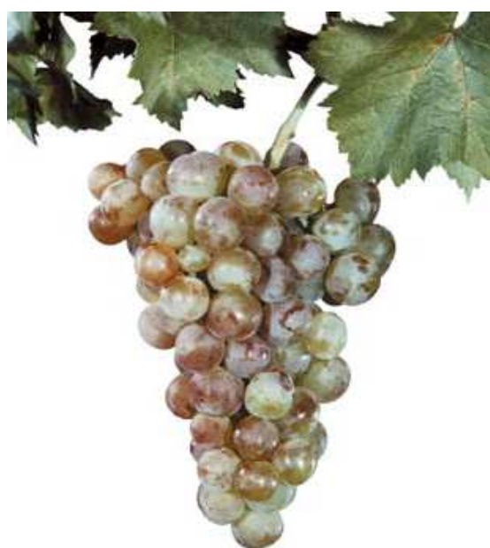
Рис. 4. Столовый сорт Новоукраинский ранний

программах, а также в селекции при создании пластичных сортов винограда, использование которых в производстве сможет повысить рентабельность виноградно-винодельческой отрасли России. Наряду с базовыми коллекциями обоих регионов, сформированы учебные маточники сортов винограда, которые наиболее распространены в промышленных насаждениях. Здесь проводятся учебные мероприятия, рабочие и показательные дегустации перспективных сортов винограда.