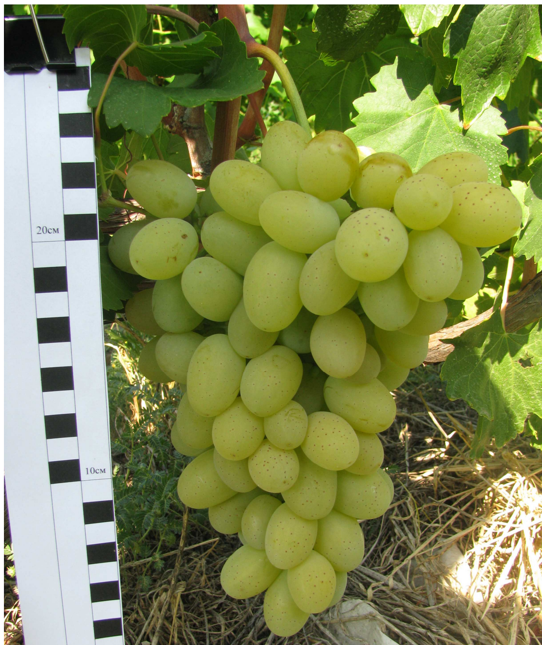
Рис. 6. Столовый сорт винограда Солнечная гроздь

селекционного и клонового происхождения – районированные Ливия К (рис. 7), Боготяновский, Гелиос, Долгожданный, Кубаттик, Низина, Преображение, Рошфор К, Хризолит, Цитрин, Антрацит, перспективные Анюта, Байконур, Гурман Крайнова, Памяти Учителя, Подарок Несветая, Юбилей Новочеркаска и др.