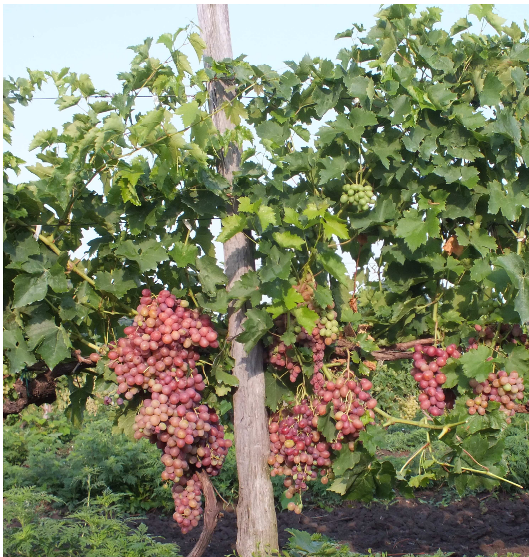
Рис. 7. Столовый сорт винограда Ливия К

Сортообразцы базовой Магарачской и дочерней Анапской коллекций винограда используются для реализации международных научных программ, в т.ч. в проектах, которые проводятся под эгидой Международного института по биоразнообразию (Bioversity International, Италия). По результатам изучения сортообразцов обеих коллекций опубликованы многочисленные каталоги, методики, статьи и т.д. [5-10, 12, 15-31, 33, 35-36].