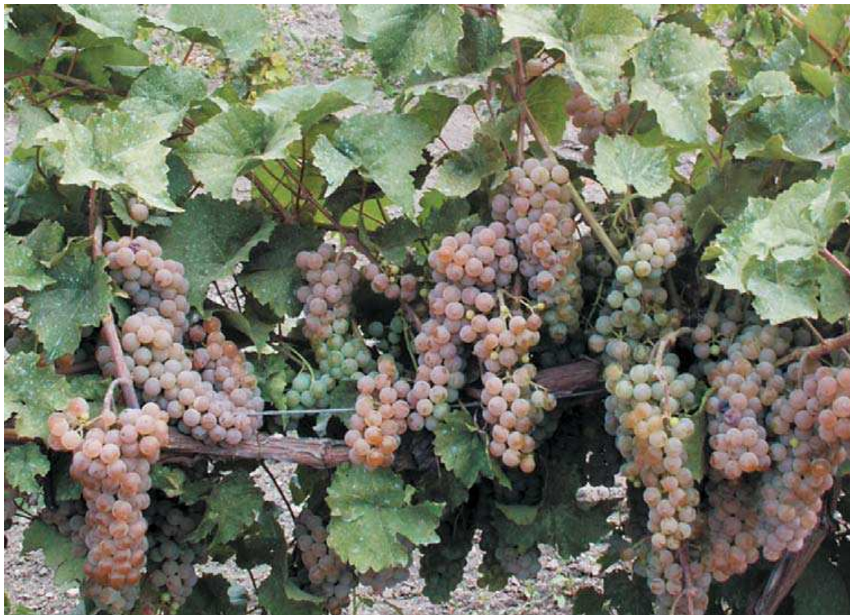
Рис. 3. Комплексно-устойчивый технический сорт Подарок Магарача

На протяжении многих лет на базе ампелографической коллекции проводится селекционная работа по созданию новых генотипов, в частности, гибридизация с использованием аборигенных сортов винограда. Таким образом созданы сорта Партенит, Первенец Магарача, Подарок Магарача, Рислинг Магарача, Фиолент и др. [6]. Здесь же созданы районированные сорта Новоукраинский ранний (рис. 4), Академик Авидзба, Гранатовый Магарача, Крымчанин, Ркацители Магарача, Спартанец Магарача, Тавквери Магарача, Цитронный Магарача (рис. 5), перспективные Ливия, Солнечная гроздь (рис. 6) и др.