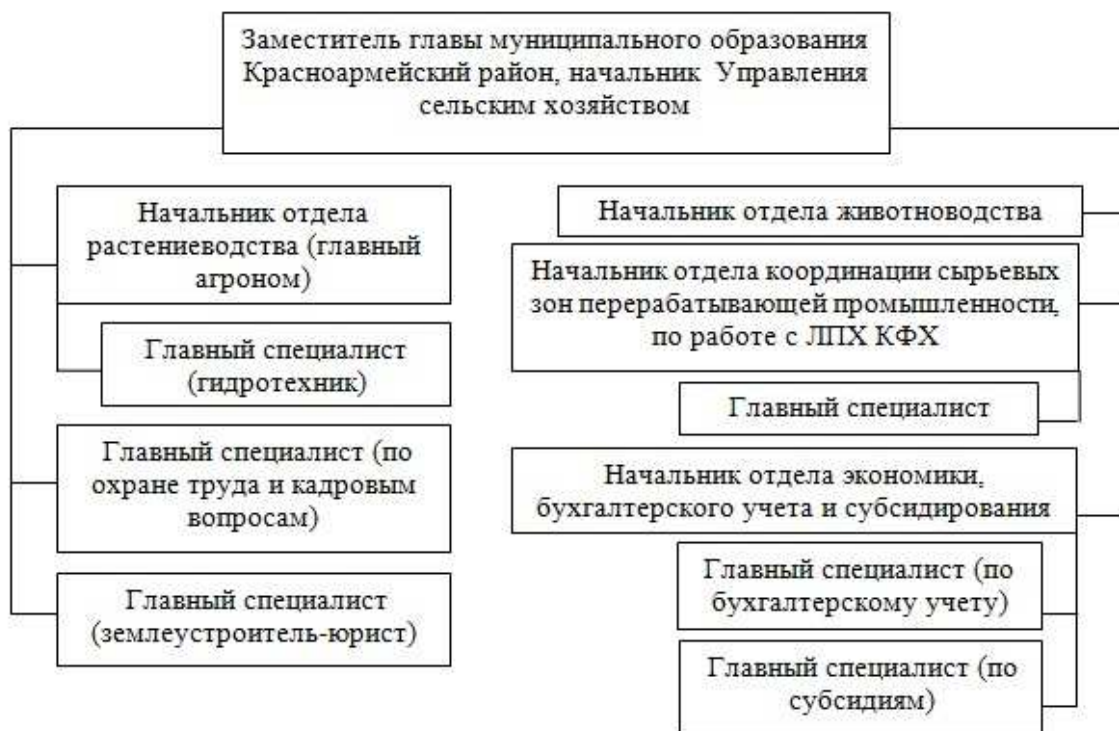
Рисунок 4 – Проектная организационная структура Управления сельским хозяйством администрации МО Красноармейский район после введения должности землеустроителя-юриста

хозяйством администрации МО Красноармейский район предлагаемых рекомендаций по оптимизации структуры и функций, его реестр должностей сократится до 11 специалистов.