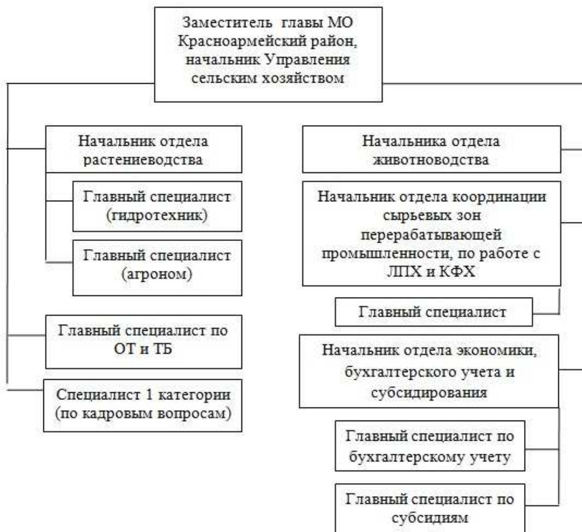
Рисунок 1 – Организационная структура Управления сельским хозяйством администрации муниципального образования Красноармейский район

В ходе изучения Положения об Управлении сельским хозяйством, должностных инструкций его специалистов и информации официального сайта Администрации МО Красноармейский район было выяснено, что его сотрудники должны выполнять следующие задекларированные функции: перспективное планирование и прогнозирование, разработка муниципальных программ, работа с малыми формами хозяйствования, составление отчетности по направлениям деятельности и др.