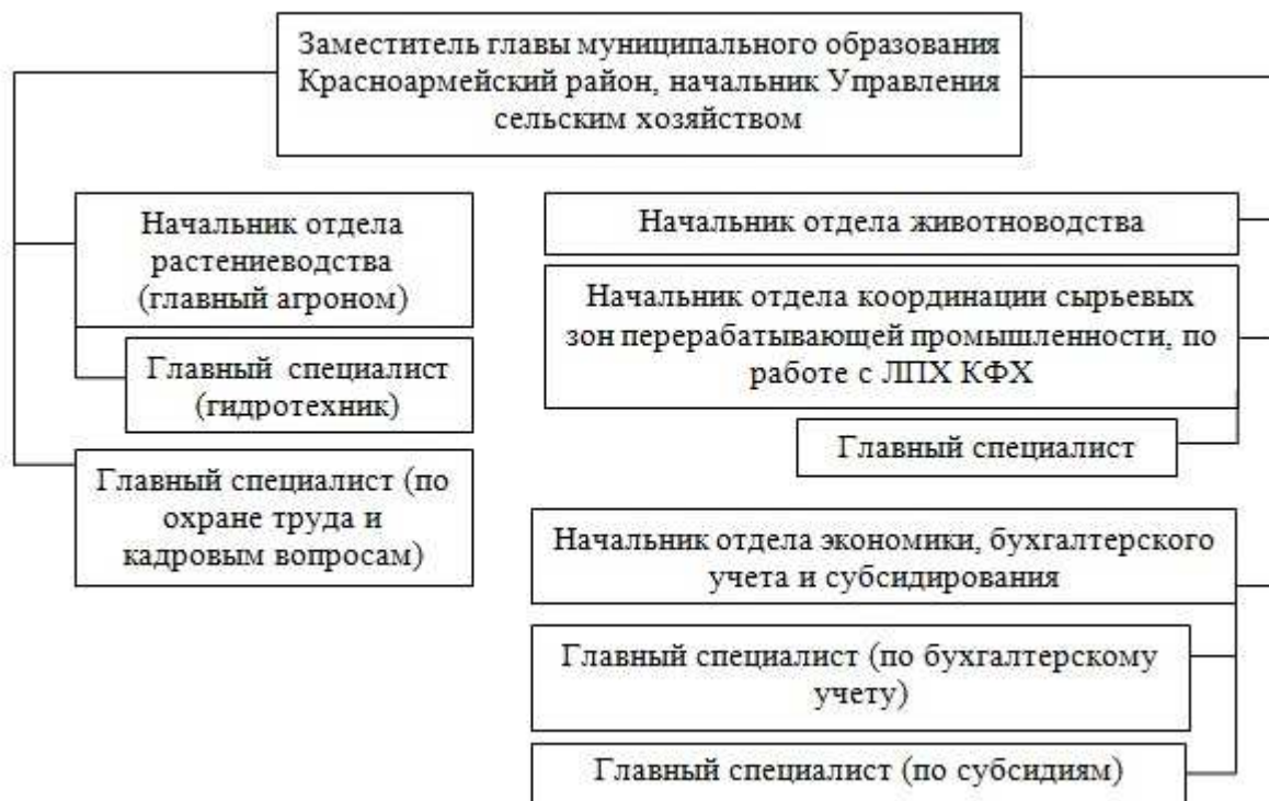
Рисунок 3– Проектная организационная структура Управления сельским хозяйством администрации МО Красноармейский район после перераспределения полномочий

Поэтому считаем необходимым внести поправки в указанный нормативный акт, дополнить текст статьи 6 Федерального закона №294-ФЗ «Полномочия органов местного самоуправления, осуществляющих муниципальный контроль» следующей компетенцией: «организация и осуществление муниципального земельного контроля на территории соответствующего муниципального образования». Считаем необходимым закрепить предлагаемую компетенцию следующими функциями: