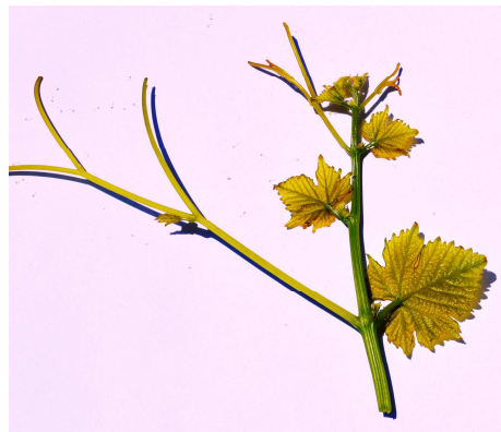
Рис. 1-2. Верхушка молодого побега сорта винограда Радость Леонидов.

052 - интенсивность антоциановой окраски: 3 - слабое;