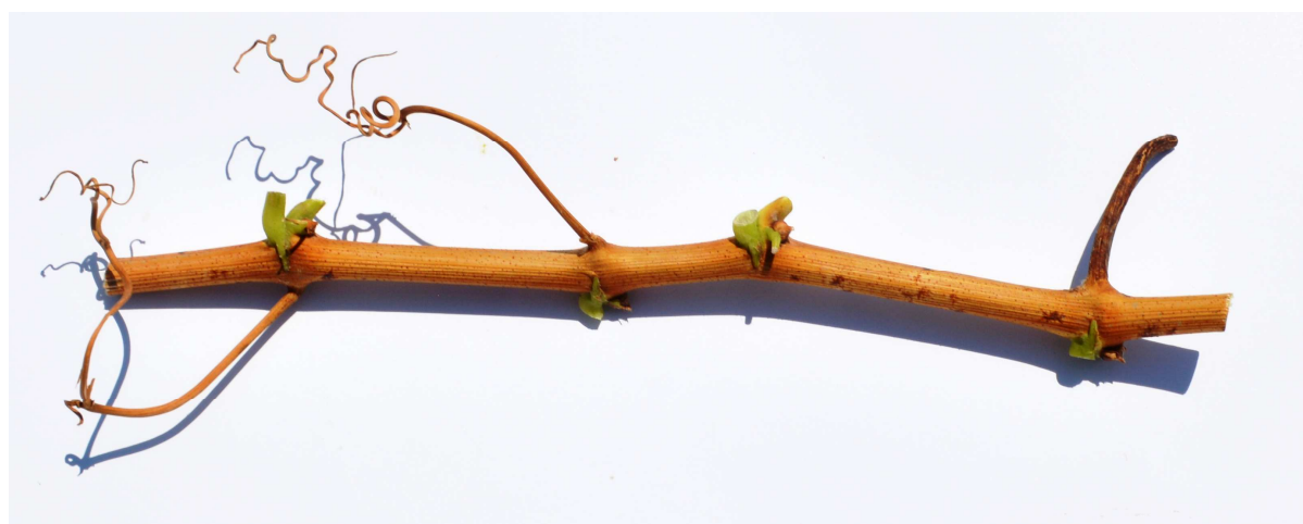
Рис. 10-11. Распустившийся глазок и одревесневший побег сорта винограда Радость Леонидов.