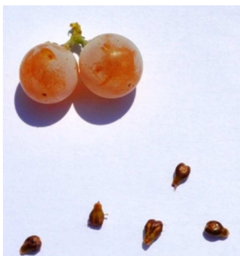
Рис. 8-9. Гроздь, ягоды и семена сорта винограда Радость Леонидов.