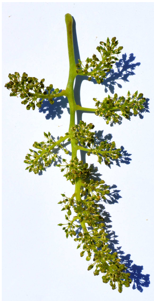
Рис. 7. Соцветие сорта винограда Радость Леонидов.

206 - длина ножки грозди: 1 - очень короткая, приблизительно 3 см;