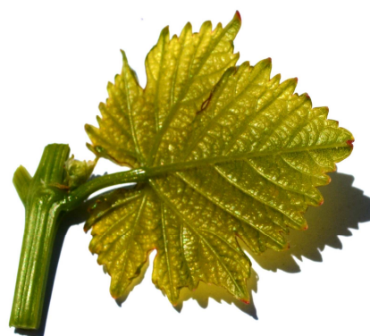
Рис. 3-4. Молодой лист сорта винограда Радость Леонидов.

055 - плотность паутинистого опушения на главных жилках нижней поверхности листа: 5 - среднее;