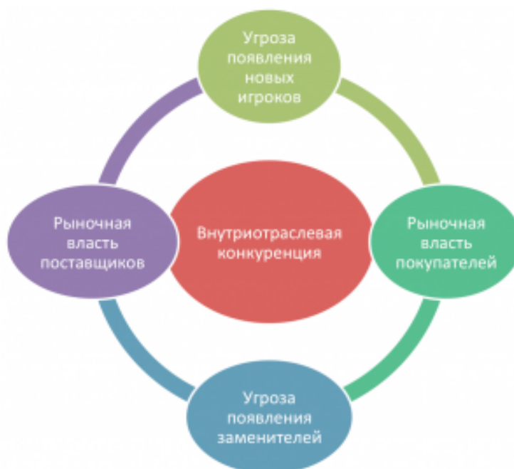
Рисунок 2 – Матрица конкуренции Майкла Портера

Данные элементы рынка являются движущими силами рыночной конкуренции (рисунок 2).