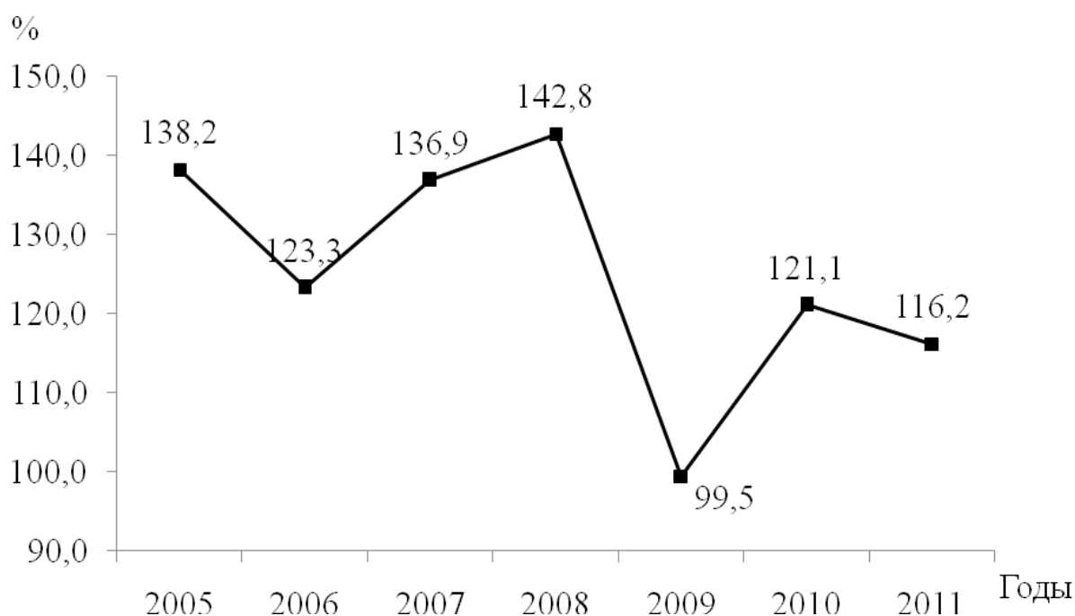
Рис. 3. Динамика индексов объемов реализации рыбы и рыбной продукции предприятиями Республики Крым

Изменение индексов объемов реализации рыбы и рыбной продукции показано на рисунке 3.