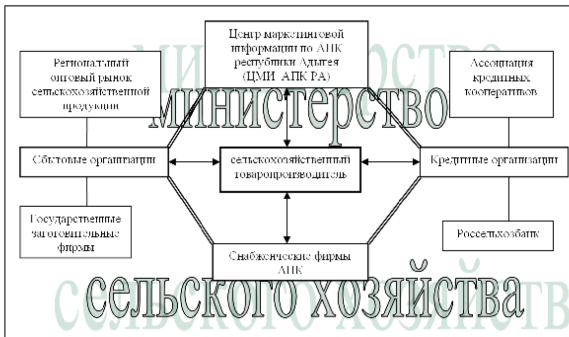
Рисунок 2 – Рекомендуемое строение рыночной инфраструктуры АПК Республики Адыгея

Данная организация рыночной инфраструктуры АПК Республики Адыгея позволит обеспечить прозрачность сделок, централизацию рыночных услуг, а следовательно, позволит установить тесное взаимодействие институтов рыночной инфраструктуры. Подобная система облегчит ведение статистического учета и контроля, обеспечит открытость информационных потоков, что позволит анализировать, контролировать и прогнозировать динамику развития инфраструктурных элементов, а также обслуживаемых ими товаропроизводителей.