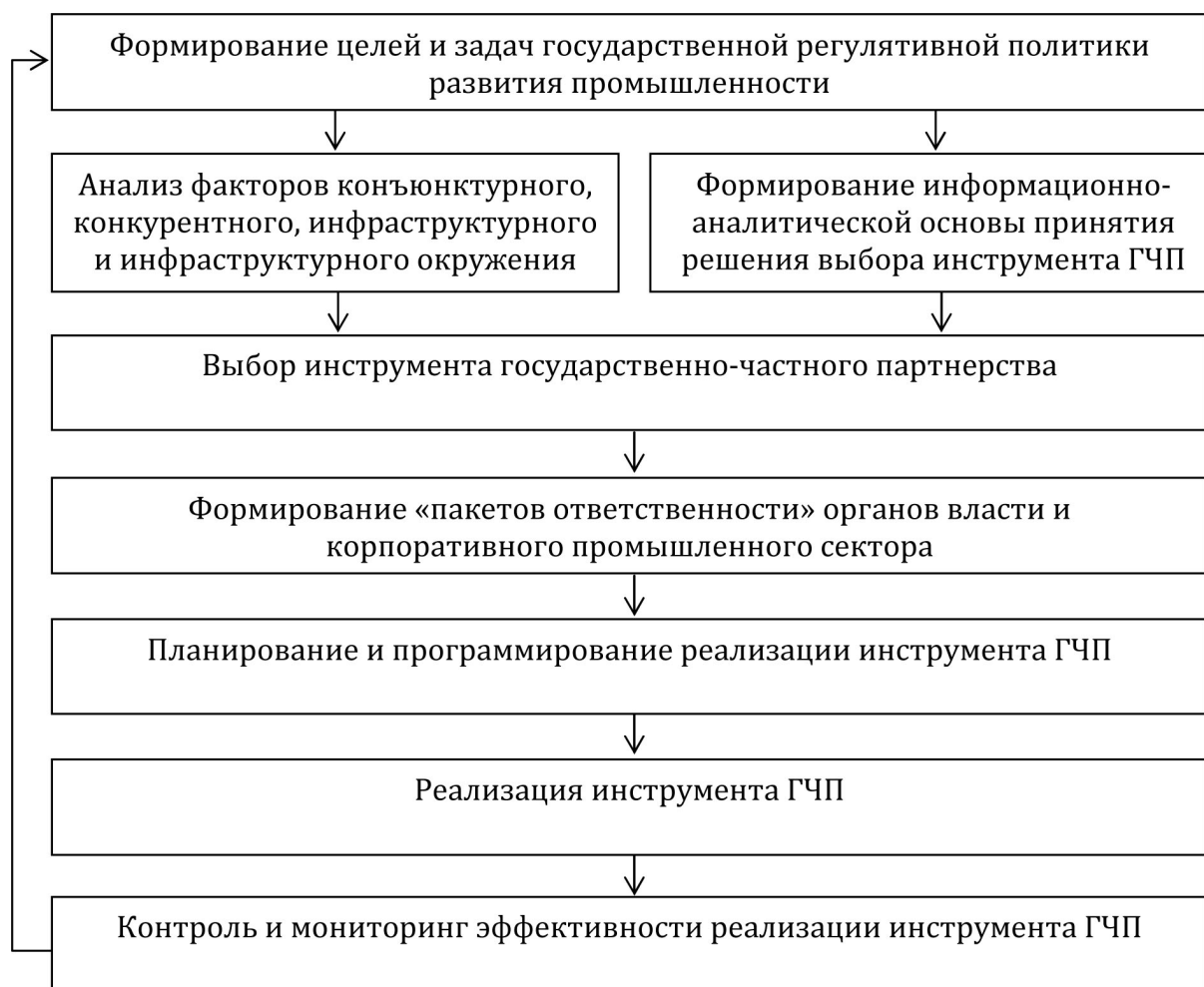
Рисунок 2 – Последовательность формирования и реализации инструментов ГЧП для развития региональной промышленности

На рисунке 2 приведены этапы формирования инструментов государственно-частного партнёрства в контуре мер развития региональной промышленности.