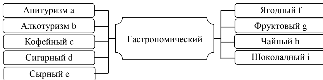
Рисунок 2 – Разновидности гастрономического туризма

Апитуризм, иными словами медовый туризм, подразумевает под собой путешествие на пасеку для ознакомления с процессом производства меда, дегустацией и последующей покупкой продуктов пчеловодства. На сегодняшний день пасеки являются объектами туристических экскурсий, привлекая внимание потребителя возможностью оценить производимый продукт на месте, проследить цепочку производства, непосредственно поучаствовать в таинстве создания меда, приобрести обладающие лечебными свойствами продукты по более низкой цене. Мировым лидером по апитуризму считается Словения.