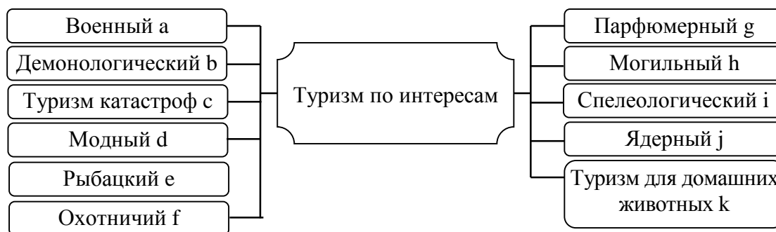
Рисунок 3 – Разновидности туризма по интересам

К туризму по интересам можно отнести достаточно много появившихся туристических направлений, выделим основные из них (рис. 3).