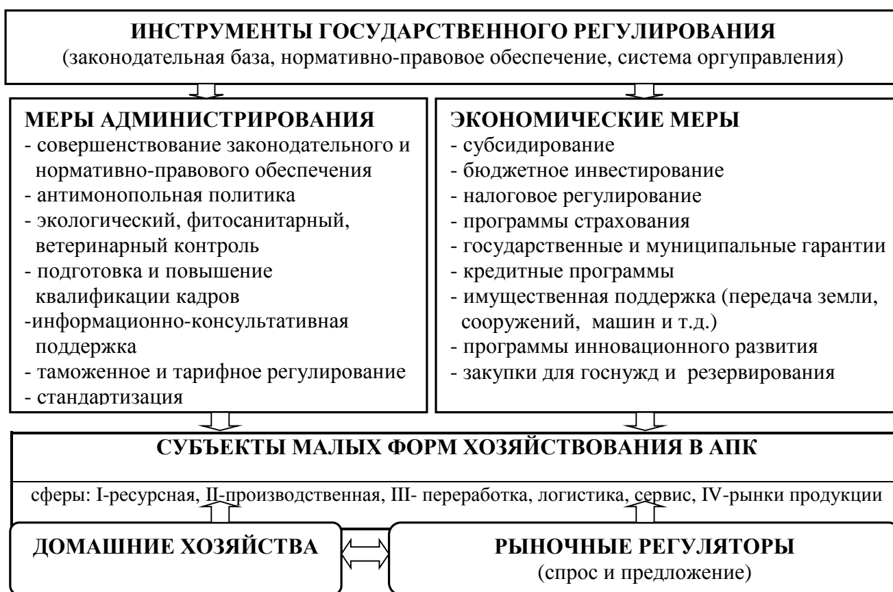
Рисунок 2 – Экономические и административные инструменты государственного регулирования МФХ

Таким образом, домашние хозяйства выступают основным инвестором, регулятором всей рыночной цепочки в механизме функционирования не только малых форм хозяйствования, но и всей экономики в целом (рисунок 2).