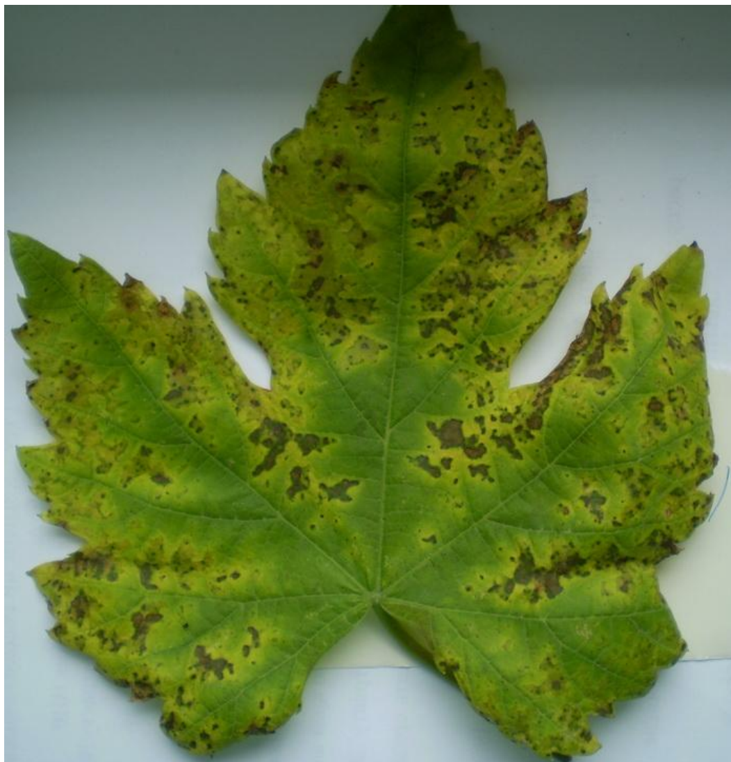
Рис. 11. Альтернариоз на листе.

мя только начинаются разработки мер борьбы с этим коварным заболеванием.