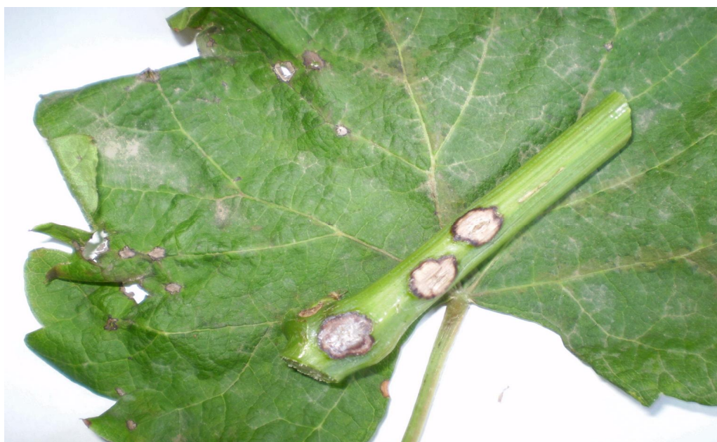
Рис. 9. Антракноз на листе и на побеге.

Антракноз стал особенно заметен в последние десятилетия в годы с повышенной увлажненностью в ранневесенний период на восприимчивых сортах Августин, Молдова, Дойна, Ранний Магарача и др. (рис. 9).