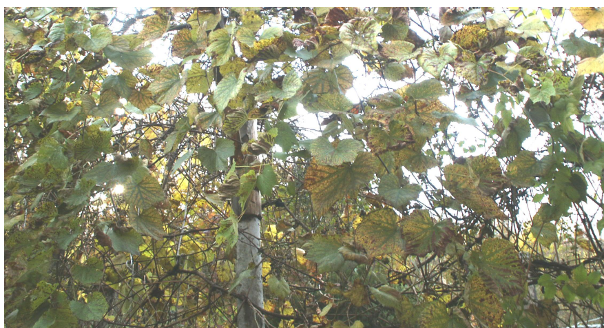
Рис. 2. Листовая форма филлоксеры.

Листовая форма филлоксеры активно развивается на подвойных сортах, распространенных межвидовых сортах Бианка, Молдова, Дойна, Августин, Первенец Магарача, стала осваивать в качестве кормовой базы европейские сорта Каберне-Совиньон, Алиготе, Шардоне и другие (рис. 2).