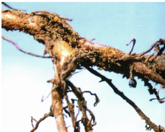
Рис. 1. Корневая форма филлоксеры.

Листовая форма филлоксеры активно развивается на подвойных сортах, распространенных межвидовых сортах Бианка, Молдова, Дойна, Августин, Первенец Магарача, стала осваивать в качестве кормовой базы европейские сорта Каберне-Совиньон, Алиготе, Шардоне и другие (рис. 2).