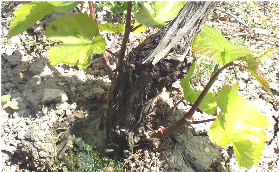
Рис. 3. Бактериальный рак.

цидов системного действия, а также отсутствием эффективных мероприятий, сдерживающих опухолеобразование.