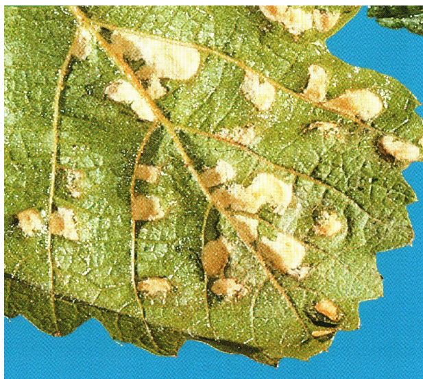
Рис. 5. Виноградный зудень.

В последние годы активизировалась группа сосущих вредителей (клещи, трипсы, цикадки). Особенно активно осваивают виноградники цикадки и виноградный зудень Eriophyes vitis Pgst. (рис. 5), заселенность которого от 0,1% до 40%, особенно на интродуцированном из Италии посадочном материале.