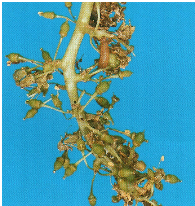
Рис. 4. Гроздевая листовертка.

Из «сезонных» вредителей повсеместно встречаются гроздевая листовертка Lobelia botrana Den. et Schiff, которая в основном развивается в трех поколениях (рис. 4).