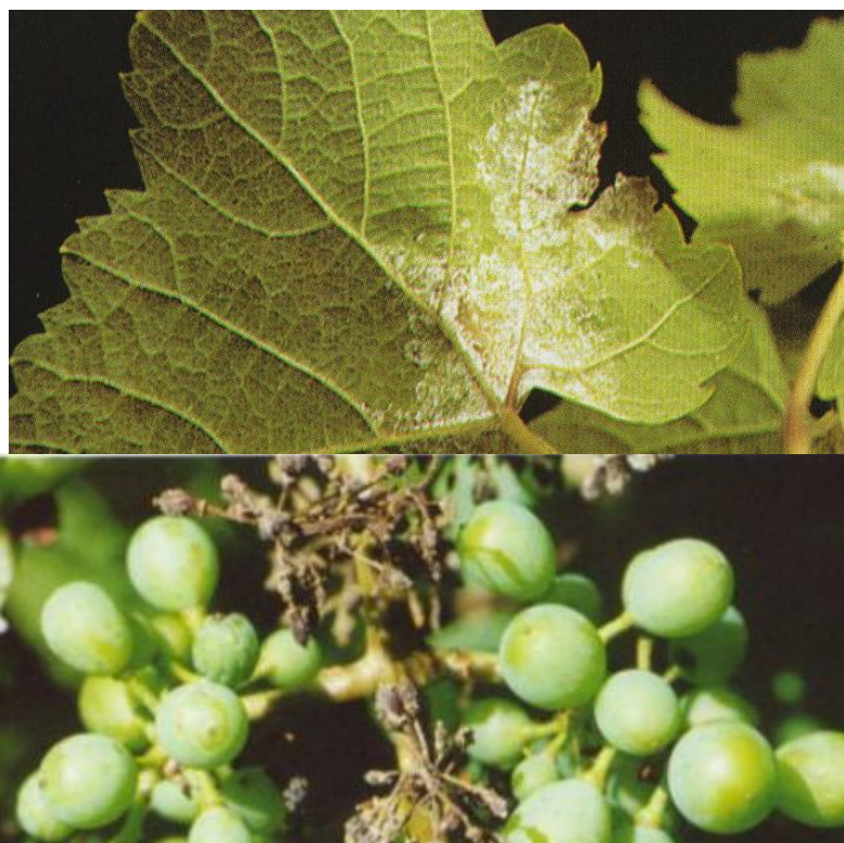
Рис. 6 и 7. Милдью на листе и на грозди.

По-прежнему доминирующими остаются заболевания милдью Plasmopara viticola Berl. et Tony, оидиум Uncinula necator Burr., антракноз Gloeosporium ampelophagum Sacc. К милдью среди районированных сортов более 65% высоковосприимчивы к болезни. В виде эпифитотии милдью развивается 6-7 раз за 10 лет и может вызывать потери от 50 до 100% урожая текущего года, несмотря на наличие большого числа фунгицидов, способных сдерживать вредоносность этого заболевания. В отдельные годы эпифитотии распространялись на 50% площадей виноградников страны (рис. 6-7).