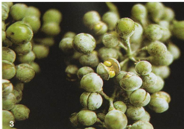
Рис. 8. Оидиум на гроздях.

Проблемной остается и защита от этого заболевания, так как большинство триазолов и стробилуринов при несоблюдении разработанного исследователями регламента их применения малоэффективна. Интенсивное использование дитиокарбаматов, триазолов и других групп химических соединений привело к появлению рас, устойчивых к большинству современных фунгицидов.