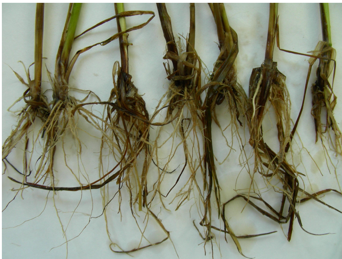
Рисунок 2. Поражение корневой системы грибами из рода Fusarium .

Нормальное функционирование корневой системы растений озимой пшеницы на первых этапах онтогенеза зависит от степени поражения корневыми гнилями. Мониторинг возбудителей корневых гнилей показал, что в годы исследований они были в основном представлены микромицетами из рода Fusarium (рисунок 2).