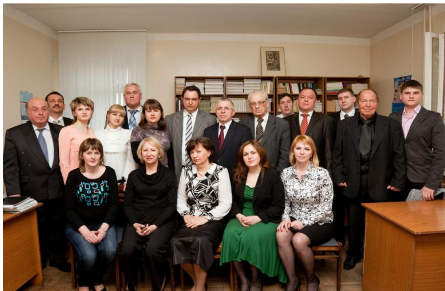
Фотография 6. Кафедра экономики и ВЭД.

подразделением крупнейшего аграрного вуза страны. В ее составе 25 человека, в том числе 8 профессоров, 8 доцентов, 2 старших преподавателя, 4 ассистента, 3 лаборанта (фотография 6.).