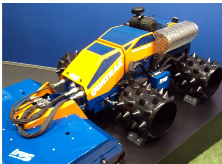
Рисунок 2. Робот для работы на крутых склонах