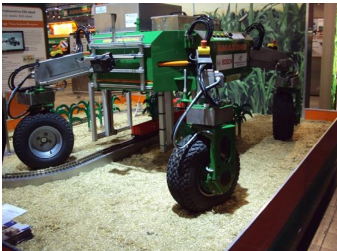
Рисунок 3. Робот с гидродвигателями встроенными в колеса

TERRA TRAC системы позволяют избежать уплотнения почвы, улучшает комфорт оператора, обеспечивают быстрые скорости (40 км / ч).