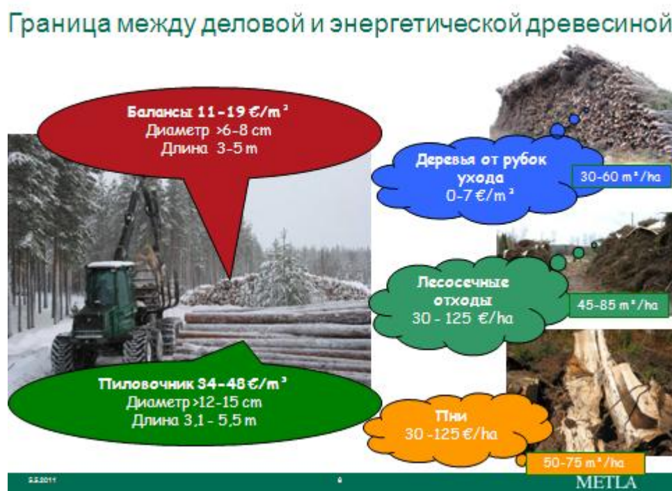
Рисунок. 1. Взаимосвязь между древесной биомассой и деловой древесиной

Взаимосвязь между древесной биомассой и деловой древесиной показана на рисунке 1.