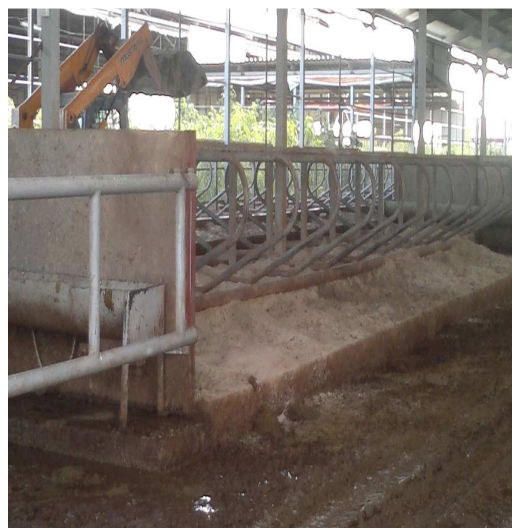
Рисунок 4 – Боксы с подстилкой в виде песка

В каждой секции установлена автоматическая поилка с подогревом воды в зимний период (рисунок 5).. Коровы свободно подходят к ней, по мере уменьшения воды поилка автоматически наполняется вновь проточной водой. Под крышей корпуса размещены потолочные вентиляторы (рисунок 6). Они при необходимости не только понижают температуру в помещении на 3-4 градуса, но также не дают проникать в корпус вредным насекомым.