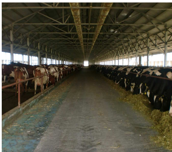
Рисунок 3 – Интерьер нового коровника

приподнятые над навозным проходом на 20 см, чтобы навоз не попадал на пол места отдыха коров, а сами коровы оставались чистыми. В качестве подстилки в боксах используется песок, который по мере загрязнения очищается, моется и сушится в специальном цехе, построенном по американскому проекту, а затем вновь используется для подстилки (рисунок 4). Между секциями, в середине коровника размещена кормовая платформа («кормовой стол»). Сюда подают 5 раз в сутки корм трактором-кормораздатчиком, фирмы «Siloking», приготавливающим кормосмесь по заданной компьютерной программе. Коровы свободно подходят к корму в любое время суток. Обслуживающий персонал периодически подгребаёт рассыпанный корм на платформе ближе к животным.