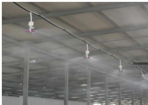
Рисунок 7 – Водные оросители в работе в летние дни