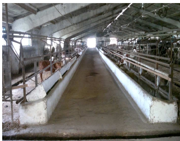
Рисунок 2 – Интерьер старого коровника используемого для содержания телок

Новые корпуса для коров связаны между собой проходом, который ведет к доильному цеху. В каждом новом коровнике (рисунок 3) расположены четыре секции для отдельного содержания животных различных физиологических стадий. В секциях размещены индивидуальные боксы рядами по центру (50 боксов в одном ряду),