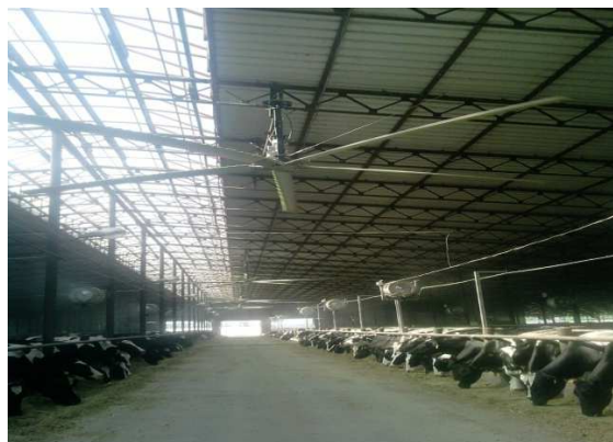
Рисунок 5 – Автоматическая поилка с подогревом воды Рисунок 6 – Потолочный лопастный вентилятор

При температуре воздуха в коровнике 15-18^{\circ}\text{C} вентилятор автоматически вращался со скоростью 13 оборотов в минуту, при температуре 19-21^{\circ}\text{C} – 22 раза; при температурах - 22-24^{\circ}\text{C} ; 25-27^{\circ}\text{C} и 28-30^{\circ}\text{C} соответственно 41, 50 и 53 раза в минуту.