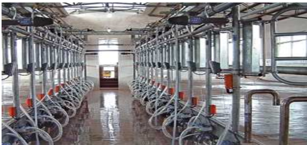
Рисунок 9 – Общий вид доильной установки

На ферме используется трехкратное доение коров. В доильном зале работает установка типа «Параллель» на 40 доильных станков, по 20 с каждой стороны (рисунок 9).