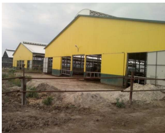
Рисунок 1 – Внешний вид нового корпуса для содержания коров телок

Результаты исследований и обсуждение. В коровнике новой конструкции основой несущего каркаса служит балка переменного сечения, выполненная из черного металла. Крыша выполнена из холодногнутого тонкостенного оцинкованного профиля. В виде брезентовых штор выполнены стены здания, которые поднимаются и опускаются по мере необходимости, при этом животные защищены от сквозняков, осадков и палящего солнца. Зоны отдыха защищены от ветра и дождя. Торцевые стены, а также ворота закрыты «профлистом». На крыше вдоль всего корпуса размещен прозрачный конек с вентиляционными каналами, который обеспечивает хорошее освещение днем без дополнительного электроосвещения. Размеры корпуса: длина – 100, ширина - 22 метра (рисунок 1). На ферме также пока использовался старый классический Российского проекта корпус для содержания телок (рисунок 2).