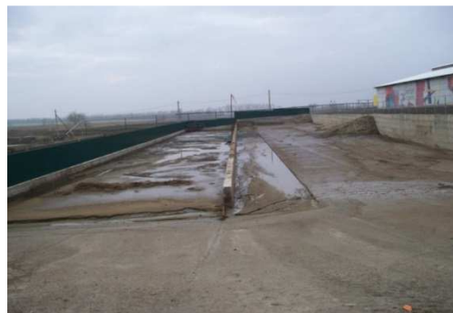
Рисунок 8 – Первый и второй каналы цеха очистки песка

Из этого котлована насосом по трубам очищенная вода вновь поступает в навозный канал. Чистый песок из первого канала собирается трактором в гурты, после просушки и вновь используется для подстилки. А жидкость с высокой концентрацией растворенного навоза вывозится на поля в качестве удобрения. При работе такого цеха затрачивается минимальное количество ресурсов, таких как вода, песок и электричество. За зимний период в хозяйстве расходуется до 200 тонн песка, в летний 300 тонн. В сравнении с другими хозяйствами, в которых используется подстилка-песок, но нет цеха по его переработки, используется не менее 500 тонн песка в месяц.