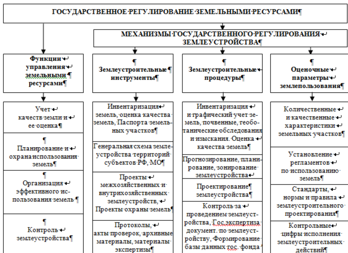
Рисунок 2. Методическое обеспечение государственного регулирования земельными ресурсами

Данная схема методического обеспечения государственного регулирования земельными ресурсами для их эффективного управления допускает восстановление системы учета и оценки качества земельных ресурсов сельскохозяйственного назначения ранее существующей, а также предполагает меры по мониторингу фактического состояния и наличия данной категории земель (инвентаризацию земельных участков; оценку качества земель сельскохозяйственного назначения; геодезические и картографические работы; почвенные, геоботанические, агрохимические и другие обследования и изыскания). Это, несомненно, позволит создать необходимую базу информации о количественном и качественном состоянии земель и, http://ej.kubagro.ru/2017/10/pdf/87.pdf