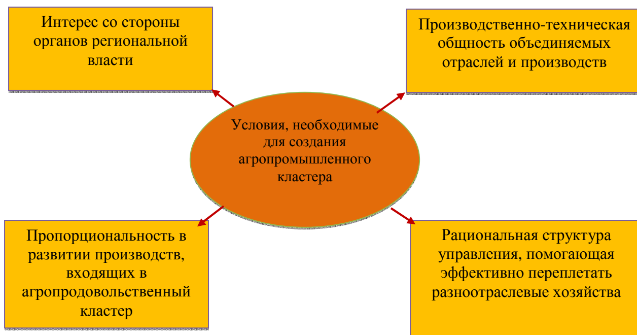
Рисунок 2 - Условия, необходимые для создания агропродовольственных кластеров

Как правило, под общиной понимают некую целостную социальную систему, в основе которой заложено народовластие, реализуемое на общем собрании членов объединения. Совместное землевладение является базисом общины. Независимо от развитой или неразвитой форм общин, как правило, проводимая ими экономическая политика не позволяла при стратегическом планировании достигать долговременной устойчивости этих социальных систем, что вызывало к жизни иждивенческие настроения и ожидания дотаций со стороны государства.