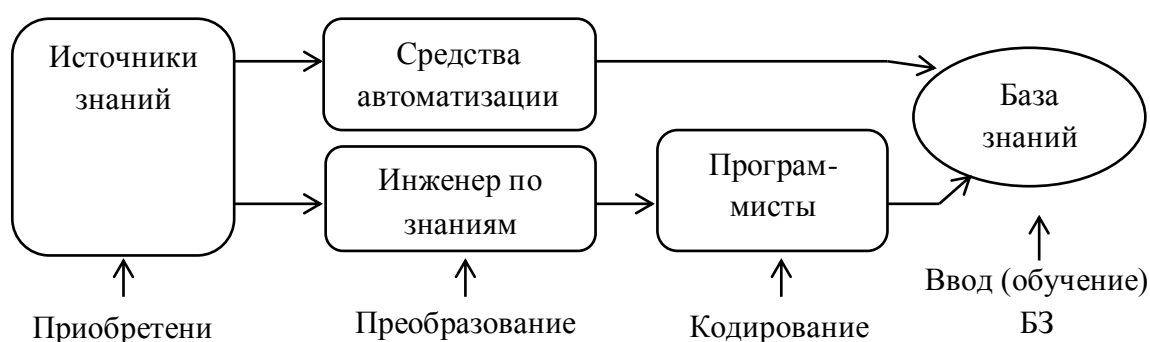
Рисунок 3 – Процедура приобретения знаний

На рисунке 3 представлена схема процедуры приобретения знаний.