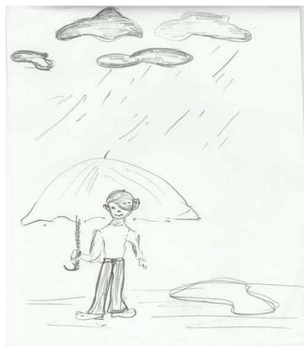
Рис. 1 Рисунок женщины с низкой самооценкой в ситуации эмоциональной стабильности.

Женщины, имеющие высокую самооценку, проявляли нетерпение с момента начала исследования, торопились, комментировали ход исследования. По мнению экспертов, с воспитанием детей справляются, однако проявляют излишнюю жесткость. Нужно отметить, что обе группы женщин и с низкой и с высокой самооценкой жаловались на загруженность, усталость, что «головы поднять некогда, а тут вы». Анализ результатов методики «Человек под дождем» выявил некоторые особенности реагирования в стрессовых ситуациях женщин с разным восприятием себя как матери. Так, женщины с успешным опытом социализации но имеющие низкую самооценку себя как матери в эмоционально стабильном состоянии рисовали фигуры своего пола (рис.1), рисунок занимал среднюю часть листа или весь лист, что не соответствовало критериям низкой самооценки.