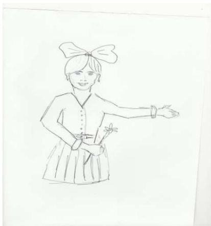
Рис. 3 Рисунок женщины с высокой самооценкой в ситуации эмоциональной стабильности.

В группе женщин с проблемной социализацией с высокой самооценкой себя как матери рисунки в состоянии эмоциональной стабильности хоть и располагались в верхней части листа, но при этом отличались отсутствием значимых деталей (ног, туловища) (рис.3).