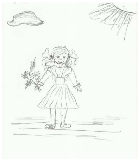
Рис. 2 Рисунок женщины с низкой самооценкой в ситуации стресса

Интерес вызывает рисунок по второй части инструкции. Так для женщин первой подгруппы и педагогов с низкой самооценкой указанной выборки свойственна смена пола человека во втором рисунке, 64% что является показателем смены стратегии реагирования в состоянии стресса (рис.2).