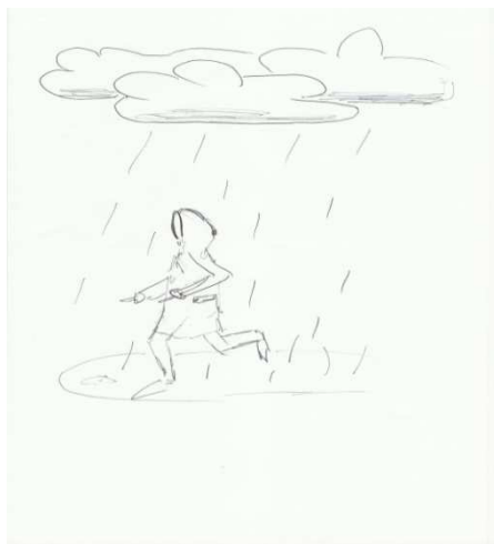
Рис. 4 Рисунок женщины с низкой самооценкой в ситуации стресса.

Так характерным для этой группы испытуемых оказалось обращение за помощью в прошлое. Женщины на рисунке отмечают наличие враждебной среды, стараются убежать от нерешенных проблем (лужи, дождь, тучи), находятся в состоянии тревоги. Отсутствие зонта у 23% женщин (неравноценная замена капюшоном) может означать стремление решать проблемы своими силами.