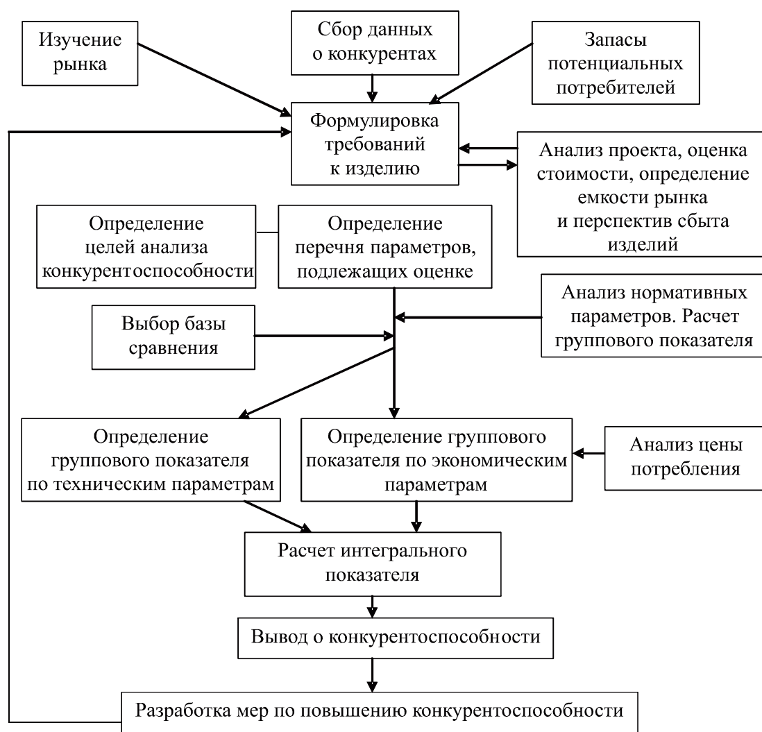
Рисунок 2 - Схема обеспечения конкурентоспособности АПК

Маркетинговые факторы определяют преимущества или недостатки в уровне конкурентоспособности товара по характеру и качеству исследовании рынка и запросов конечных потребителей, степени эффективности работы по продвижению товара на рынок, стимулированию продаж, рекламной деятельности, учету жизненного цикла товара правильности выбора ценовой стратегии, рациональности формирования сбытовой сети и каналов товаропродвижения и др.