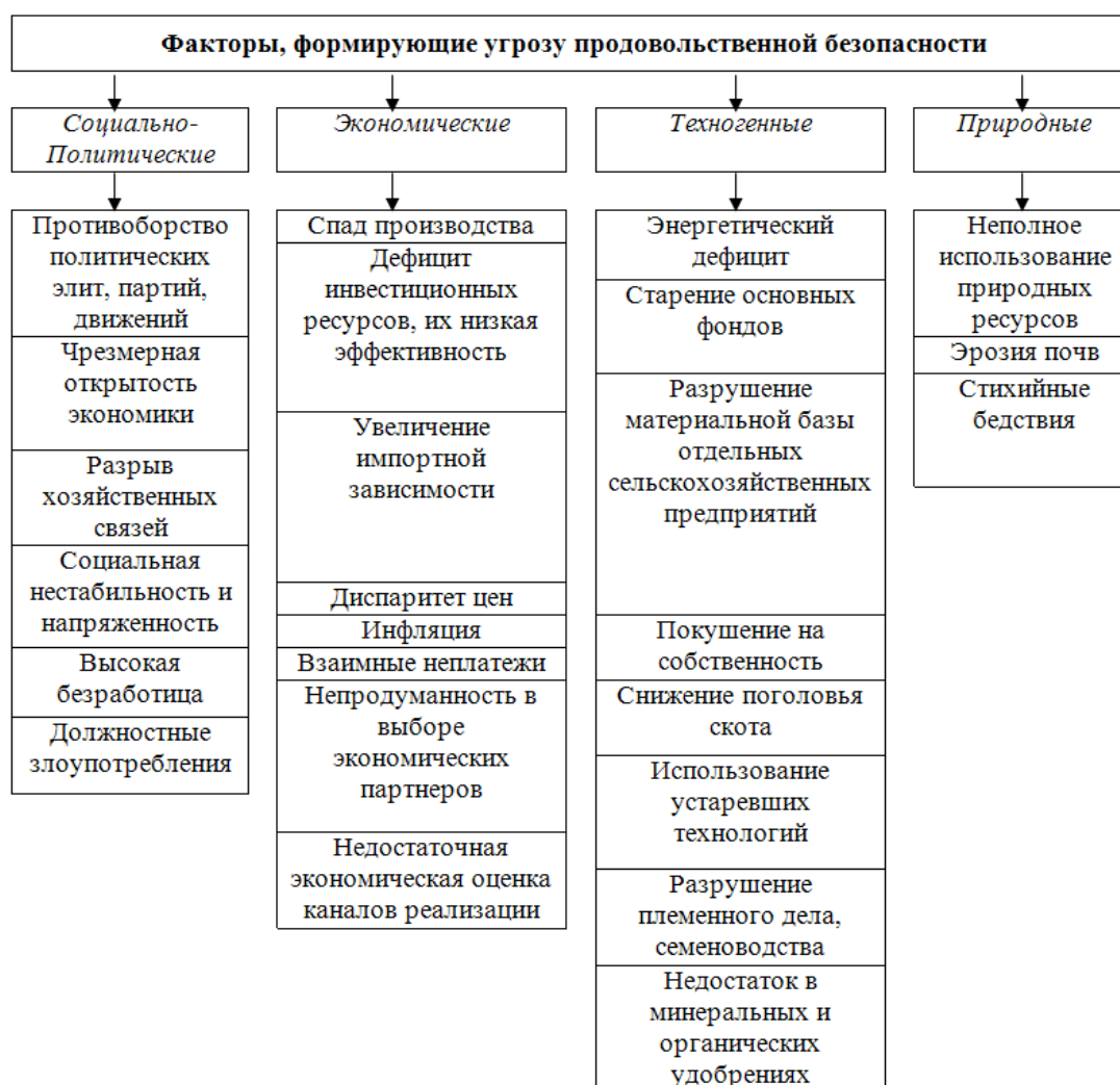
Рисунок 3 – Факторы, формирующие угрозу продовольственной безопасности

Одним из немаловажных аспектов продовольственной безопасности государства является право доступа населения к продовольствию или удовлетворение минимально необходимых потребностей в пище. Для осуществления жизнедеятельности человек должен затратить определенное количество энергии, которую он получает с пищей. Жизнедеятельность человека может быть охарактеризована его работоспособностью, если он работает, и продолжительностью жизни, которая считается наиболее универсальной характеристикой. Можно