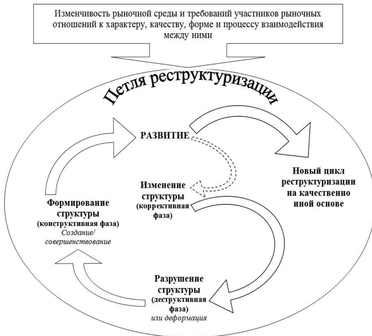
Рисунок 3 – Петля реструктуризации промышленных комплексов в регионе

Замкнутый в виде кольца реструктуризационный цикл, включающий конструктивную, коррективную и деструктивную фазы, обеспечивающие реакцию промышленных комплексов в регионе на внешние вызовы и угрозы и удовлетворяющие их потребности в самосохранении и развитии, предлагается понимать как петлю реструктуризации (рисунок 3).