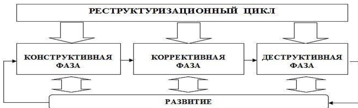
Рисунок 2 – Реструктуризационный цикл промышленных комплексов в регионе

Реструктуризационный цикл – это повторяющаяся во времени последовательность процессов изменения взаимосвязанных компонентов потенциалов промышленных комплексов в регионе, обеспечивающая его конструктивную, коррективную и деструктивную реакцию на внешние вызовы и угрозы и удовлетворяющие потребности этих комплексов в самосохранении и развитии (рисунок 2).