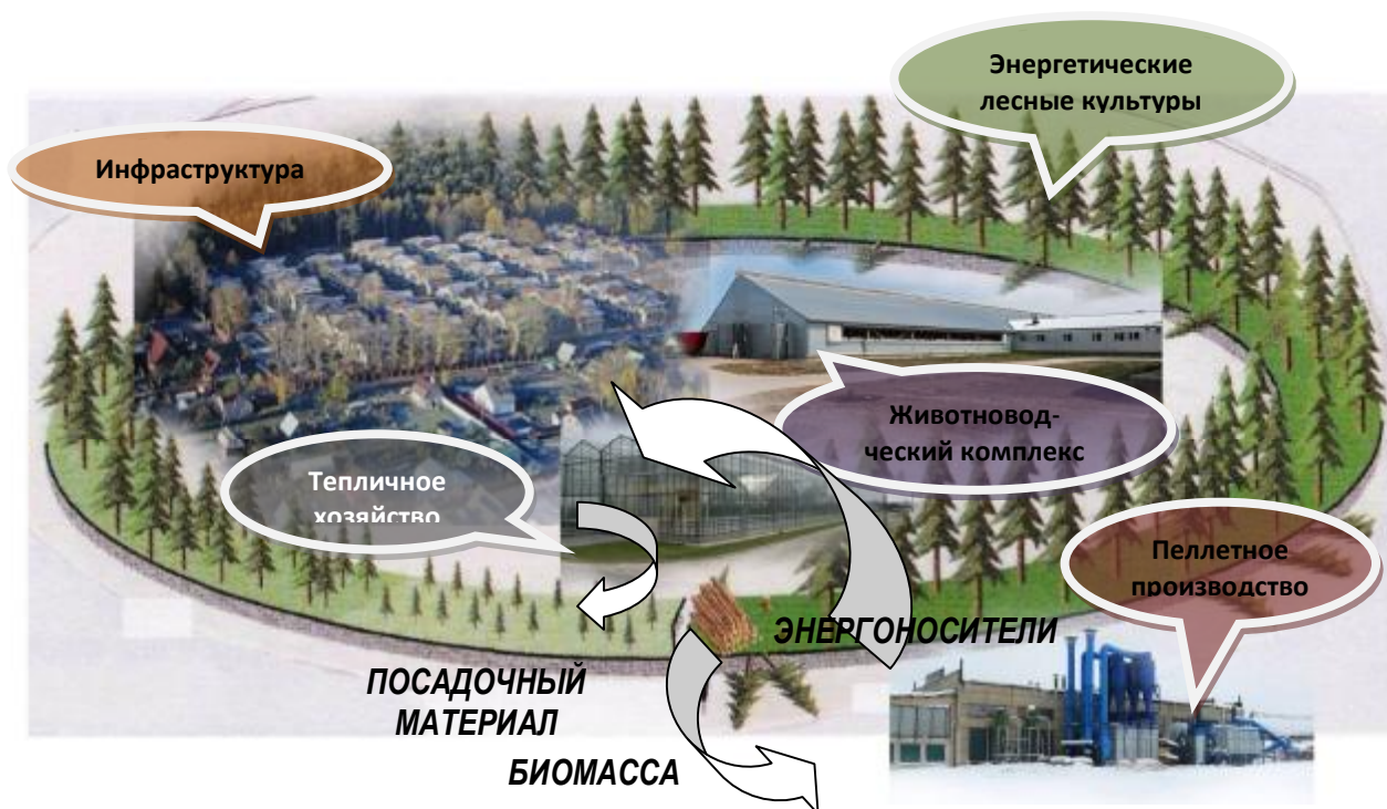
Рисунок 2 – Схема территориального агролесоводственного биоэнергетического комплекса

Ресурсной базой социально-экономических отношений в таком комплексе являются энергетические лесные культуры, весь процесс создание, выращивания и заготовки которых осуществляется специализированной организацией с технико-технологическим оснащением на базе адаптивно-модульных машинно-технологических комплексов. Затем заготовленная биомасса поставляется в качестве сырья на основное и вспомогательные производства. Основным производством в территориальном биоэнергетическом комплексе является производство энергоносителей на экспорт – обычных или термообработанных топливных гранул (простых или угольных пеллет). Главными вспомогательными производствами являются тепличное хозяйство, где выращивается посадочный материал для создания энергетических лесных культур, а также сельскохозяйственная продукция, животноводческие